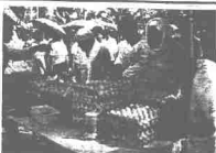
Grand opening pasar besar di pasar Pasar Negara.