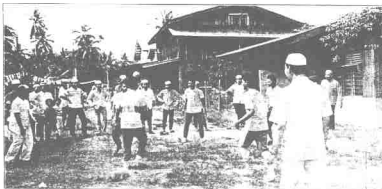
Acara sapkrage bulanan memanti perhatian peserta.