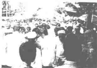
Grand opening pasar besar di pasar Pasar Negara Ipoh. (Ditutupi, Pula Phing)