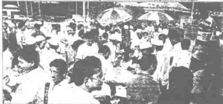
Selamatan dan penjaja di Pasar Negeri