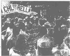
Orang ramai berhadapan dengan gerai yang dibina di Pasar Negeri

Selain itu, YDP PAS Balik Pulau mengagapkan Program Lajah Elwan dan Pembangunan PAS Negeri, Saifudin Mohamad Haniffa mengagapkan dalam usahanya bahawa semua rakyat dalam pemerintahan ini telah boleh mempergunakan khidmat di kalangan orang Islam di sini yang masa dibelikan oleh kerajaan sekiranya (MS1).