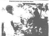
Grand opening pasar besar di pasar Pasar Negara.